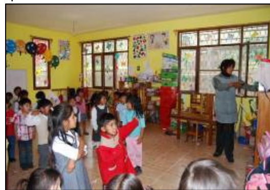
(in der Kindergartengruppe)

Mama eben gegangen ist. Dann kümmere ich mich um das Kind. Nach dem Frühstück gehen alle auf die Toilette und waschen sich die Hände. Danach geht es wieder zurück in den Kurs, wo dann verschiedenste Aktivitäten anstehen. Meistens sind es Übungen, um die Motorik der Kinder zu stärken. Mittwochs ist bei mir in der Gruppe Sporttag, da können die Kinder raus zum Rennen und Spielen, z. B. mit dem Ball oder wir machen gemeinsam Spiele.