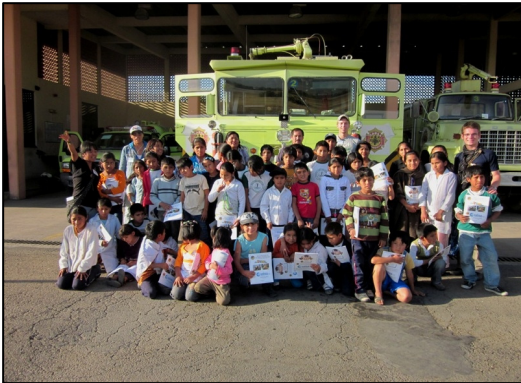
(Ausflug zur Flughafenfeuerwehr im Mai 2011)

Neben der Arbeit in den Salas gab es natürlich auch Aktivitäten ausserhalb. An zwei Freitagen im Monat sind wir zum Fussball oder Basketballspielen auf den „Sportplatz“ von Tirani gegangen, am vorletzten Freitag im Monat werden immer die Geburtstage der Kinder mit Torte und Geschenken in unserem Mehrzweckraum gefeiert.