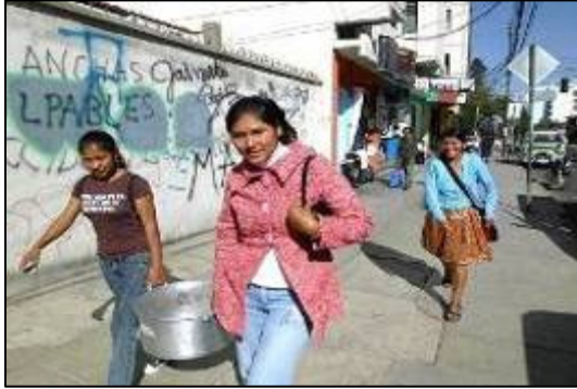
(Auf dem Weg zu den Abuelitas)

Dort wurden sie gleich dreifach gefordert: Hilfe bei der üblichen Ausgabe von Lebensmitteln (Öl, Reis und Zucker, dazu ein Stück Seife), danach Begleitung der Señoras ins Obergeschoss zum geselligen Beisammensein. Bei lauter und fetziger Musik waren sie als Tanzpartnerinnen gefragt und bei der Ausgabe des leckeren Mittagessens füllten sie die mitgebrachten Plastik- oder Blechschüsseln und servierten fachgerecht.