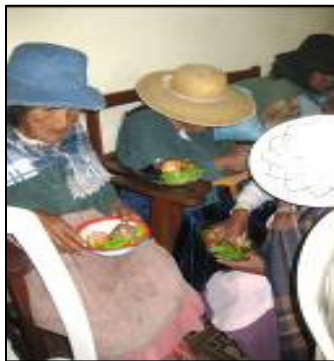
(die Abuelitas beim Essen)

Glücklich bedankten sich die Abuelitas für die Stöcke, für Tanz mit Musik der Gruppe von Voserdem, das leckere Essen und manchem Becher Sprite. Und beim Abstieg ins Untergeschoss war für einige noch einmal Hilfe nötig.